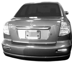
Suzuki SX4 Sport